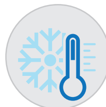
Amplia gama de uso hasta -15 °C