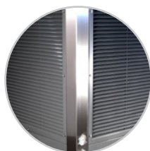
Estructura anticorrosión de acero inoxidable.