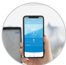
Conexión WiFi para control remoto