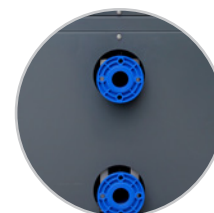
Conexiones de gran diámetro para piscinas profesionales.