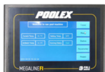
Panel de control de color de gran formato