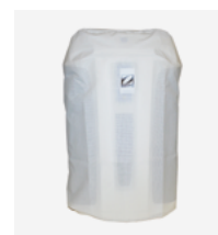
Funda de protección